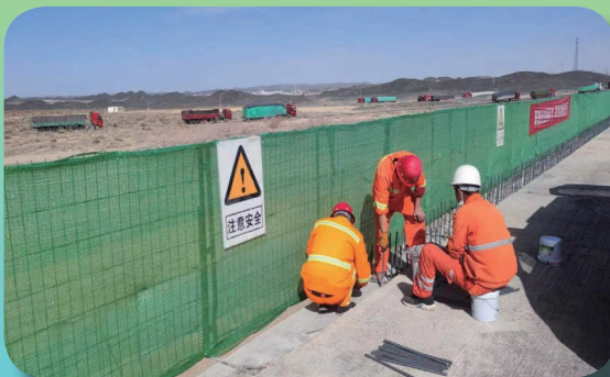
G215 线瓜柳桥 31 修复养护工程