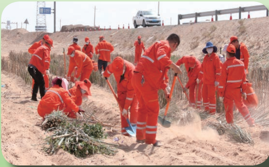
省酒泉公路发展中心机关后勤 工作人员柴草方格治沙