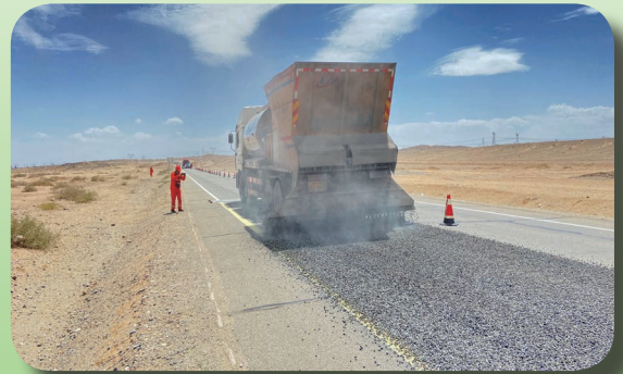
G215 线养护工程碎石封层