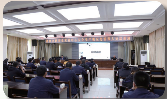
省酒泉公路发展中心安全生产暨应急 管理人员培训班