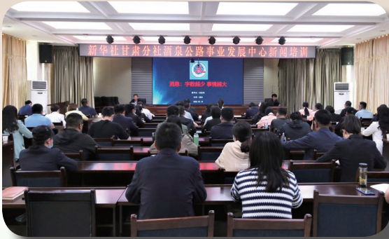
新华社甘肃分社省酒泉公路发展中心 新闻培训