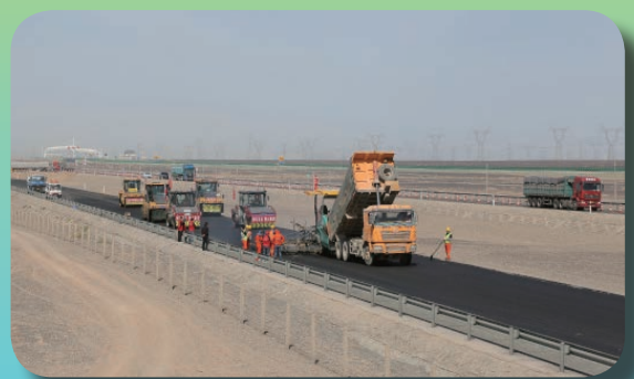
G30 连霍高速公路嘉安段 路面养护工程